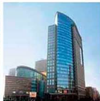
【ミュージア川崎ゲートプラザライブ】

2004年に完成したこのホールは、螺旋構造をした約2000席の客席が、中央のステージを360度取り囲むヴァンヤード形式を採用。その音響は、世界の名だたるオーケストラや音楽家から、高い評価をいただいております。