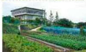
MAP C-1 Kanagawa City Agricultural Technology Support Center 川崎市農業技術支援センター

果樹、野菜、花きの試験農場。所内には一般開放されているエリアもあり、四季折々の花や果物等を観賞することができます。