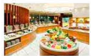
カフェレストラン「ナトゥーラ」