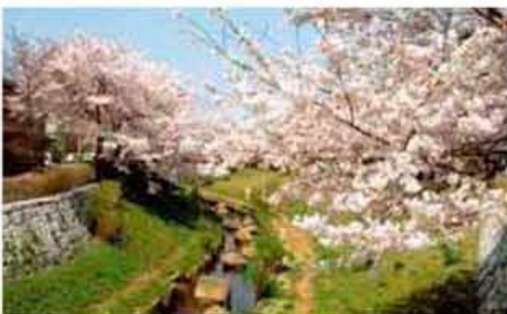
MAP D-2 Nikaryo Yousai Canal 二ヶ領用水

江戸時代に小泉次大夫によってつくられた川崎の産業のルーツといえる用水。桜の名所としても知られています。