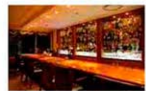
バーラウンジ「夜間飛行」