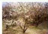
MAP F-4 Sumiyoshi's cherry blossom 住吉ざくら

約250本の桜が約2kmにわたり咲き誇ります。平成6年「かながわ花の名所100選」に選定されました。