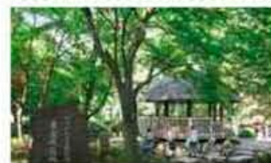
MAP E-2 Higashi-Takano Forest Park 東高根森林公園

県指定天然記念物のシラカシ林、温生植物園、地下に遺跡が眠る古代芝生広場などがあります。桜、アジサイ、ハギなど1年を通して花やイベントが楽しめます。