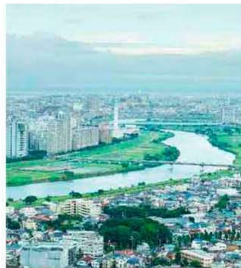
MAP E-2 Tamagawa River 多摩川

山梨県の笠取山を水源とする全長138kmの川崎の母なる川。堤防はあるものの、首都圏の一級河川でありながら、広い河川敷には、川辺の野草や野鳥が数多く見られます。またサイクリングロードが整備されています。