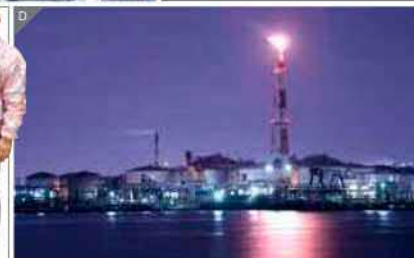
工場夜景ナビゲーター 大久保 一彦さん

■ JR川崎駅東口「川崎日新ホテル」前集合(3~9月) 18:30、(10~2月) 17:30 ■ 運航日/毎月第2、第4土曜日(毎月2回運航) 6~11月は毎週土曜日運航! ■ 料金/大人4,000円、小学生3,000円 ■ 申込み/03-6866-9608(月~土10:00~18:00) ■ Web / www.tabione.com/factory-cruise/